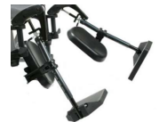
Inclinaison des repose-jambes