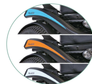
Couleurs de finition